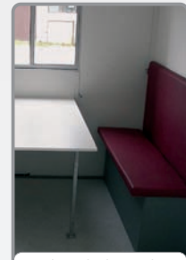
Bank m. hoher Lehne