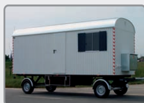
Büro- u. Lagerwagen